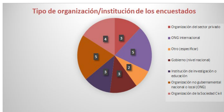
Figura 1: Tipo de organización y/o institución de los encuestados